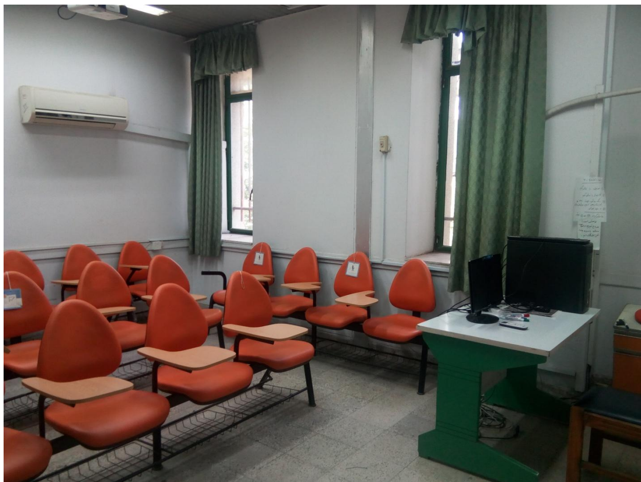
نمایی از کلاس گروه فیزیولوژی