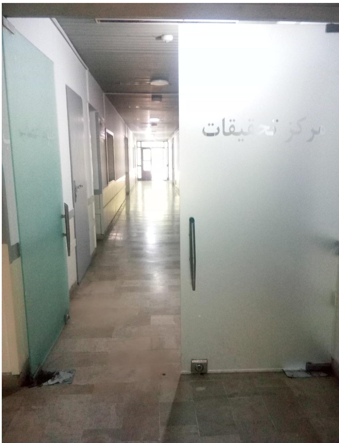
نمایی از راهروی سالن گروه فیزیولوژی