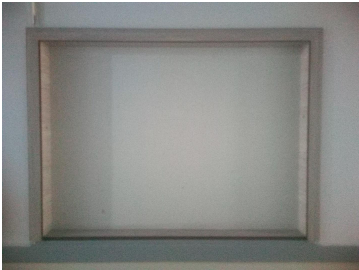
تابلوهای اعلانات گروه فیزیولوژی